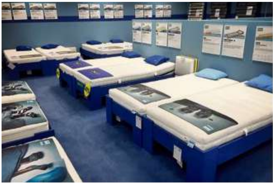
Möbel Ferrari, Hinwil: Schlafwochen