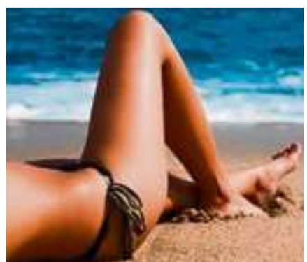
Schmink Lounge, Stäfa

Einkaufszentrum Glatt, Neue Winterthurerstrasse 99, 8301 Glattzentrum, Telefon +41 44 839 42 42, www.glatt.ch